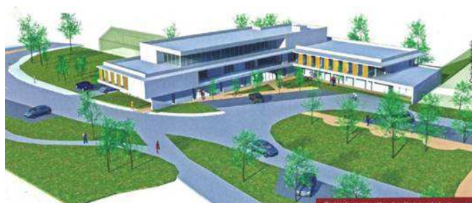
Avoine (12 logements jeunes)