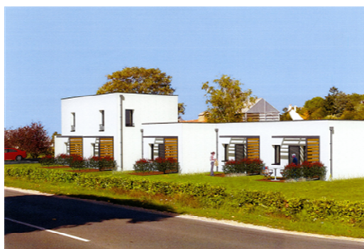
Montoire-sur-le-Loir (7 logements)

Cette étude a pour objectif de vérifier la faisabilité économique du projet retenu. Elle offre une sécurité au Maître d'ouvrage, au gestionnaire et aux partenaires financeurs qui mesurent alors les conditions de réussite de leur projet. Il s'agit d'un réel outil d'aide à la décision.